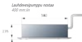
Lauhdevesipumppu nostaa 400 mm:iin