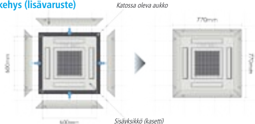
Katossa oleva aukko